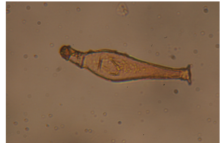
PLEUROCISTIDIO x 1000