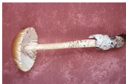
CARPOFORO (STIPITE E VOLVA)