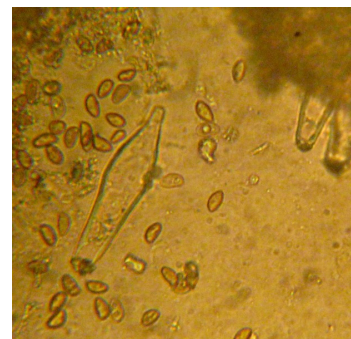
PLEUROCISTIDI - SPORE