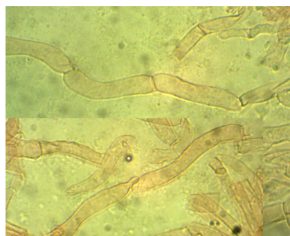
EPICUTE (IFE CON GAF)