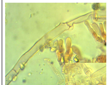
IFE CON GAF