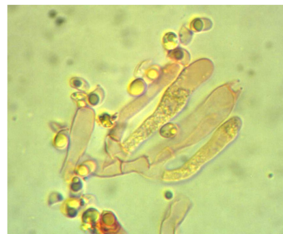
BASIDI E BASIDIOLI