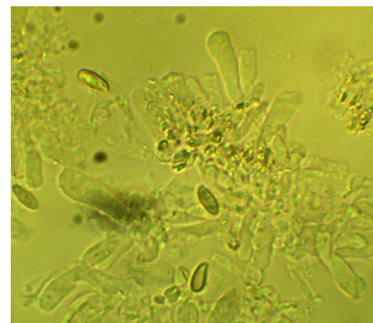
BASIDI - BASIDIOLI