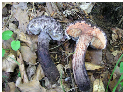
CARPOFORI - VIRAGGIO DELLA CARNE

RILIEVI EFFETTUATI SU REPERTI FRESCHI SECCHI