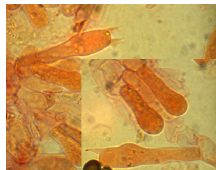
BASIDI E BASIDIOLI